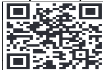
QR CODE EQU TV