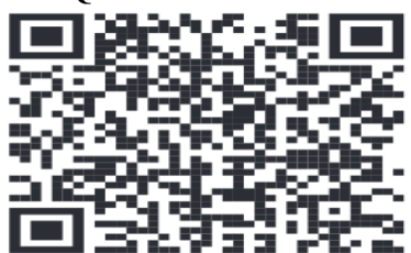
QR CODE MASAF