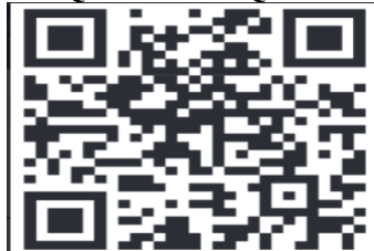
QR CODE EQU TV