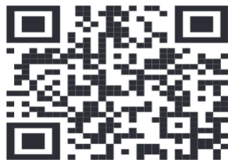
QR CODE GRANDEIPPICA ITALIANA