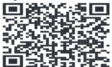
QR CODE MASAF